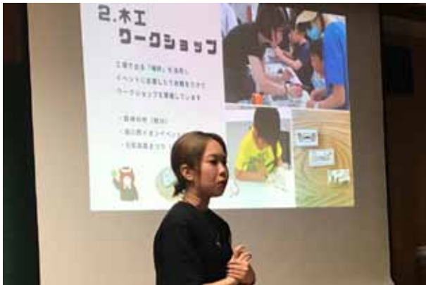
4. 木育マイスター・三津橋産業(株)／中野