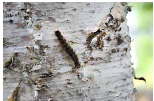
今年は、マイマイ蛾が大発生しています

北大森林研究会と粗清草堂のメンバーは、伐倒したシラカバ丸太や外樹皮・内樹皮を回収し、後日有効に使われることとなります。