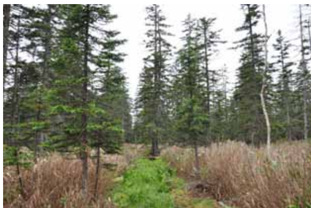
泥炭地に育ったアカエゾマツ。樹齢200～700歳

昼からは、展望台と呼ばれる高台までバスで移動。広い研究林が見渡せる場所に行き、森林全体を俯瞰する視点から説明を受けました。針広混交林の中にも樹木がなくササが広がる場所やアカエゾマツの純林が広がる場所があること、研究林の一部が人工衛星による観測活動の一つの起点になっていること、自然共生サイトに指定された経緯や目的など話題は多岐にわたります。