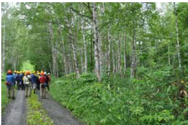
伐採予定の白樺林。伐採、掻き起し、天然更新と追います