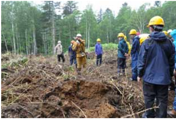
掻き起しただけのラインと、表土戻したラインを交互に