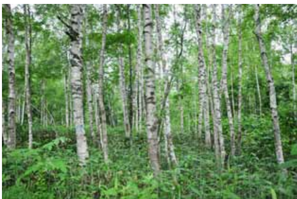
伐採予定の8haの白樺林。季節を通して森の変化を追います

北大森林研究会21名、北海道大学雨龍研究林関係者4名、林産試験場関係者1名、 林業試験場関係者3名、森林総合研究所所員1名、木育マイスター3名（木材会社社員、 山林所有者、森林管理署）、粗清草堂スタッフ3名、一般参加者8名、白樺プロジェクト関 係者5名、他1名（動画撮影協力）