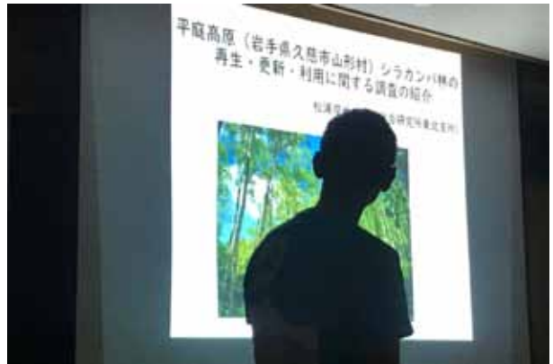
5. 森林総合研究所東北支所／松浦