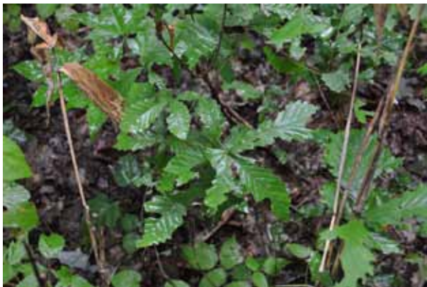
稚樹の葉がかなり虫に食われていました