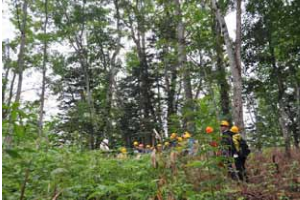
ミズナラの天然更新林