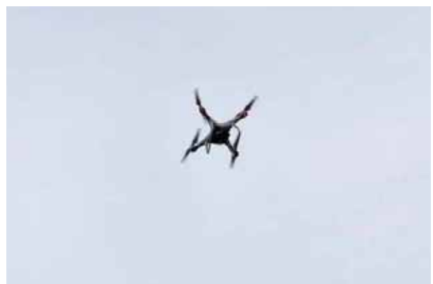
ドローン撮影も協力していただいて、空からも記録します