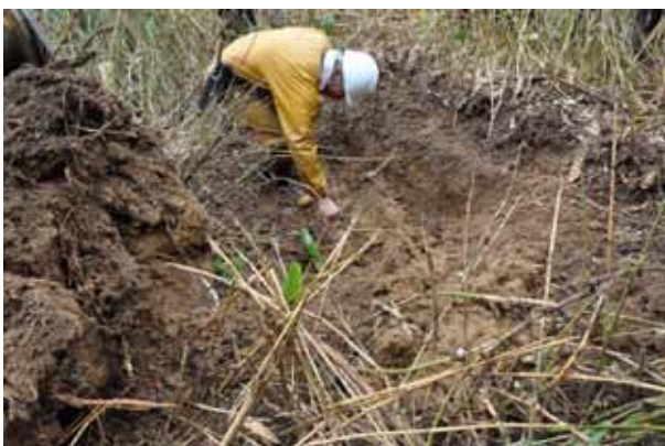
笹の地下茎を確認。地下茎の下まで土を起こします