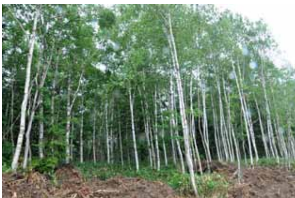
掻き起し天然更新後40年手を加えていない白樺林

12時30分に雨龍研究林研究棟に集合、あいさつと自己紹介を行った後、研究林のバスに乗り込み、車で5分ほどの原生林に到着。4班に分かれ、2班は研究林関係者が、残り2班は北大森林研究会の学生が案内役を務めました。1時間程度林内を散策。主に原生林の中でどのように樹木が更新していくかなど、案内役から出される様々な話題提供に質疑を交えながらアカエゾマツやミズナラの大木が点在する原生の針広混交林を歩きました。その後バスに乗り込み、シラカバ天然更新地に移動。今年掻き起こしをした伐採跡地では、栄養を含んだ表土を掻き起こし後に戻す「表土戻し」についての説明を受けたり、実際に重機を動かしてササの根の深さまで削り取る様子を見学したりしました。次に7年生のシラカバ天然更新試験林に移動。樹高は背丈を軽く越していて、その中でも表土戻しの有無、間引きの有無やタイミングなどで生育状況が変わる様子を観察しました。研究林の担当教授の説明だけではなく、研究林をフィールドとして研究を行う学生からも土壤菌類の視点から興味深い説明も行われました。移動中のバスの車窓からも、40年ほど前に天然更新で育成した同じシラカバ林でも、強い間引きをした場所と間引きをしていない場所を見比べたりしました。