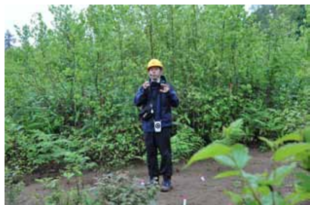
研究を行う学生からも土壌菌類の視点から興味深い説明も