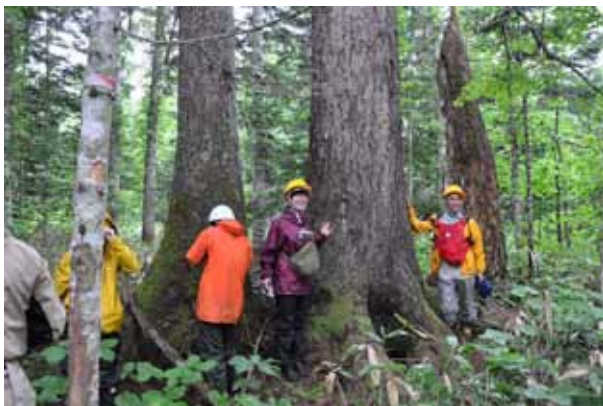
胸径1mを超えるアカエゾマツ。