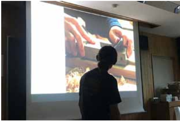
1. 北大森林研究会／藪本