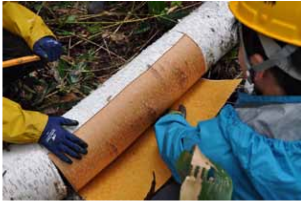
4回目の樹皮採集。今年が一番むけやすかった