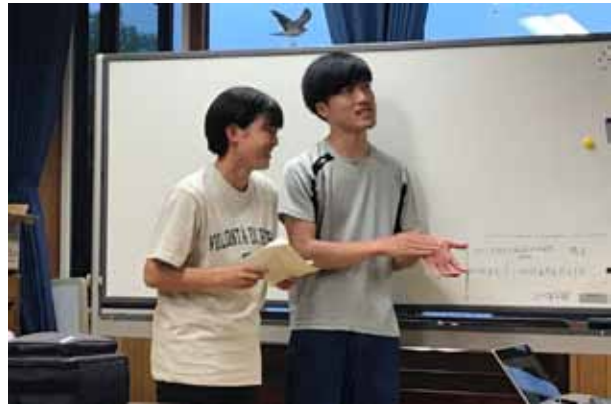
1. 北大森林研究会／矢崎・安齋