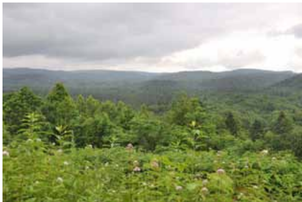
展望台。針広混交林やアカエゾマツ原生林などの展望