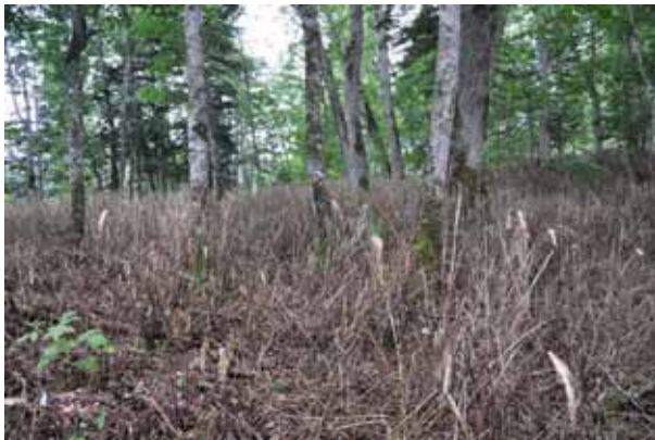
森の中の笹がほとんど枯れている。100年に一度