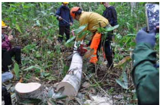
今回は2本伐採して、樹皮採集と鉛筆の材料に