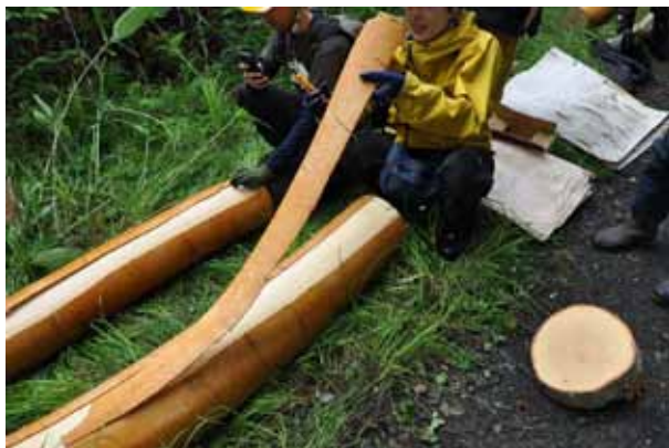
羊毛フェルトを染める内樹皮もするするとむけます