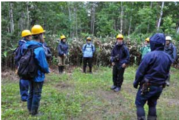
北大森林研究会の学生が案内役を務める