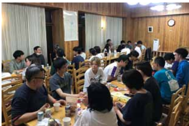
日付が変わるのも忘れるほどの意見交換

夕方研究棟に戻り、自由時間。多くの方が車で20分ほどの日向温泉に入浴しに行きました。