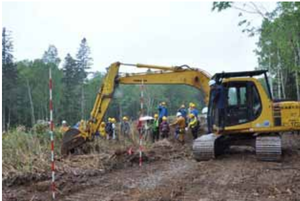
笹の根(20cm)の下くらいまで重機で掻き起こす